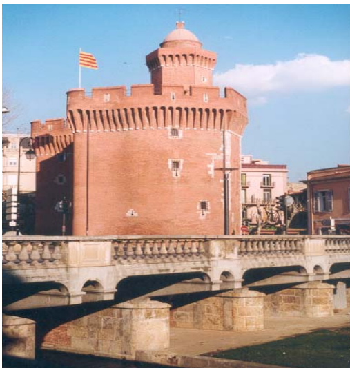
Le Castillet, à Perpignan

J'ai vraiment apprécié mon année en Estonie. Je voudrais y retourner un jour et rendre visite à mes deux familles. Je me suis beaucoup renseigné sur d'autres cultures quand j'ai habité en Estonie.